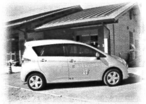
トヨタ・ラクティス

もう一台新車が入り、車椅子の方でも楽々乗り入れできる、トヨタ・ラクティスが平成27年3月19日に納車となりました。車内は揺れも少なく快適との評判です。