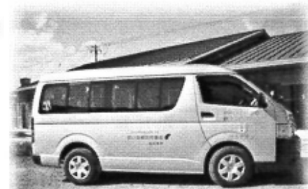
ハイエース10人乗り 配当分(1,860,000円)