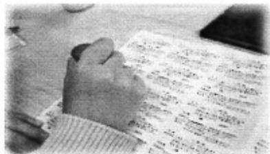
ラベルのスタンプ押し