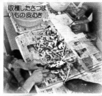
収穫したさつま いもの皮むき