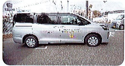
ボクシー 8人乗り (配当分 2,360,000円)

平成28年共同募金（利用者送迎用車両整備事業）に申請しておりました車両（トヨタ・ボクシー・8人乗り…車椅子1台の時は6人乗り）が平成28年11月10日に納車になり公用車として仲間入りをしました。募金をいただきありがとうございます。大切に使用させていただきます。